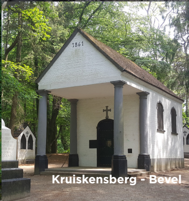
Kruiskensberg - Bevel