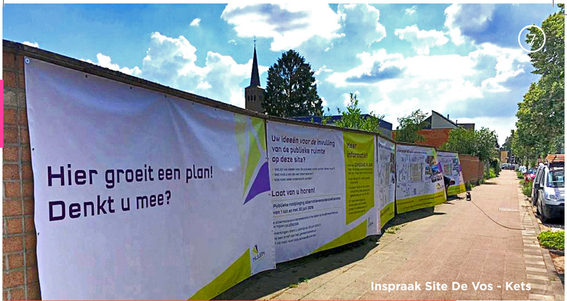
Inspraak Site De Vos - Kets