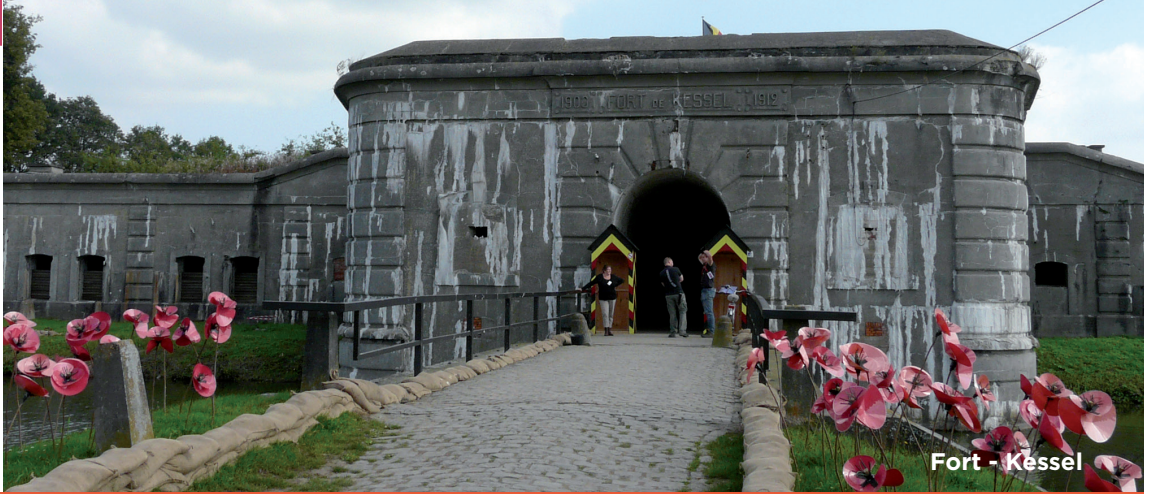
Fort - Kessel