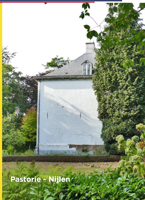
Pastorie - Nijlen

Ten slotte kiest N&U ook voor levenslang leren met ruimte voor cultuur en elkaar ontmoeten. We willen evenementen sterk ondersteunen, een nieuwe plek voor tentoonstellingen aan onze kunstenaars bieden en de Nijlense pastorie een bijeenkomst-functie geven. Zo kan de pastorie samen met het Beekpark en sportcentrum uitgroeien tot een vrijetijdssite en kunnen mensen samen genieten van al het moois dat onze gemeente en zijn inwoners te bieden hebben.