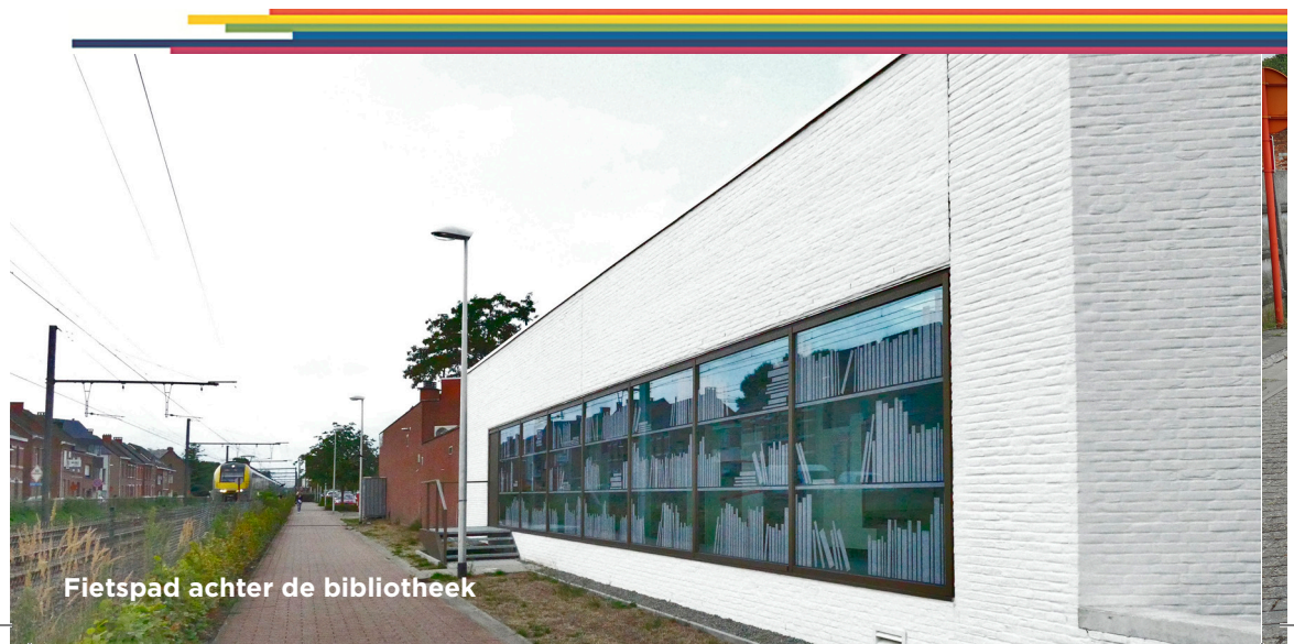
Fietspad achter de bibliotheek

Zo kiest N&U voor veilige routes voor fietsers en voetgangers, zonder in te boeten op bereikbaarheid met de wagen voor mensen die niet zo mobiel zijn. We willen het fietsen aantrekkelijker maken en wel op verschillende manieren.