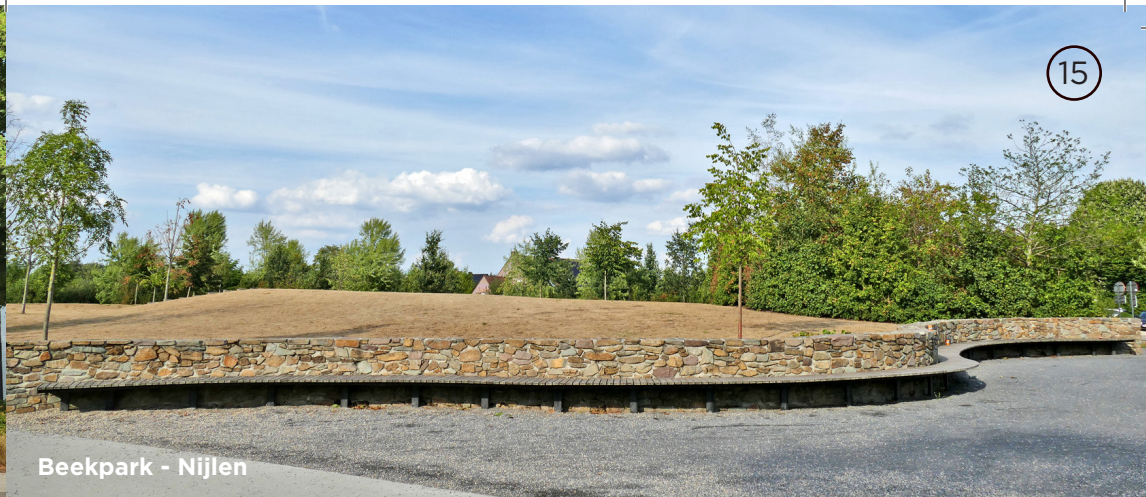
Beekpark - Nijlen