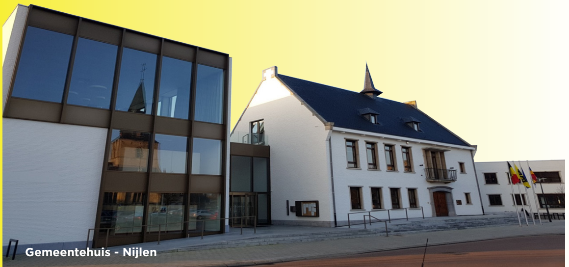
Gemeentehuis - Nijlen

Samen vrij leven in een mooie gemeente! Veiligheid en bereikbaarheid zijn kernwoorden.