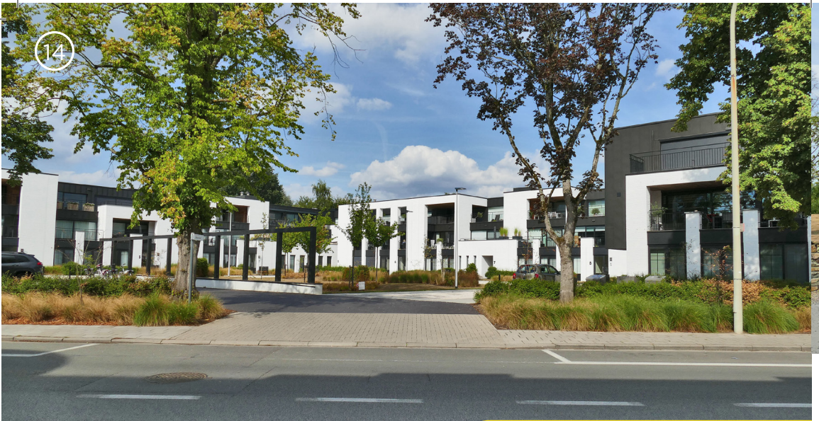
Notarishof - Nijlen