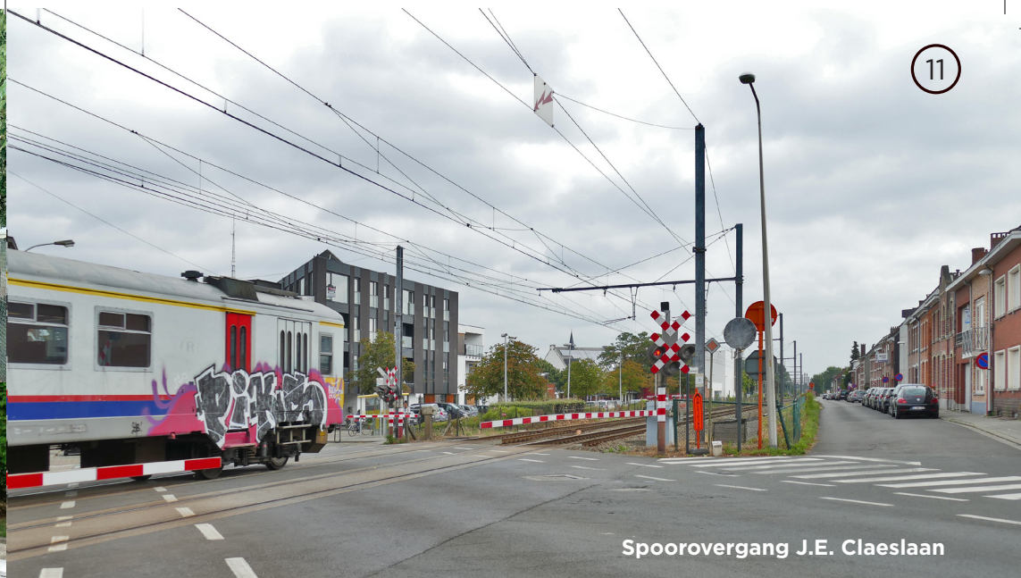
Spoorovergang J.E. Claeslaan